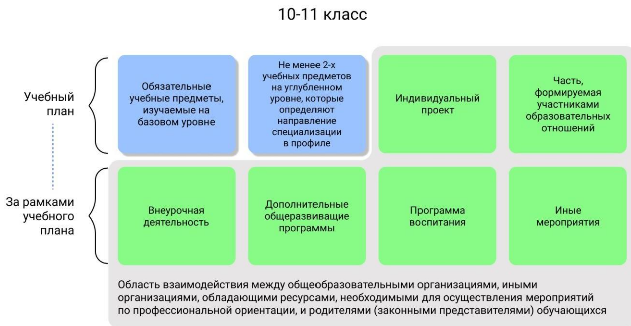
Рисунок 1 – Единая модель профориентации в профильных предпрофессиональных классах – область взаимодействия между общеобразовательными организациями и партнерами

Разработка основной образовательной программы для профильных предпрофессиональных классов проводится с учетом мнения всех категорий участников Единой модели профориентации, представленных на уровне субъекта Российской Федерации, муниципалитета.